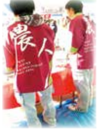
ゆるキャラ大集合★

今日は茨城へ！！ いつも畑で日々ねぎを 作っている生産部隊の 4人もイベント初参加で 京都九条ねぎを PRしてきました！